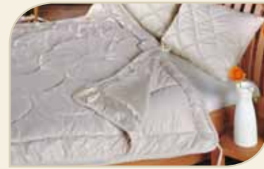
Stepdecken und Kissen