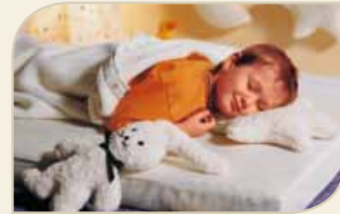
für Baby und Kind